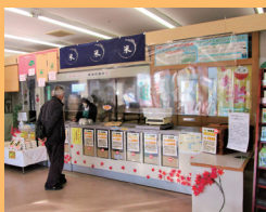
▲ふれあいパーク浅野