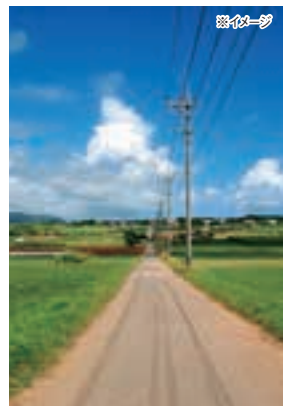
小浜島シュガーロード