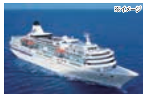
ばしふいっくびいなす