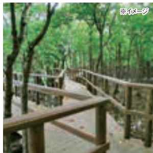
大見謝ロードパーク