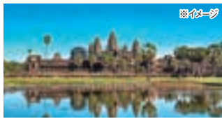
世界遺産アンコール・ワット